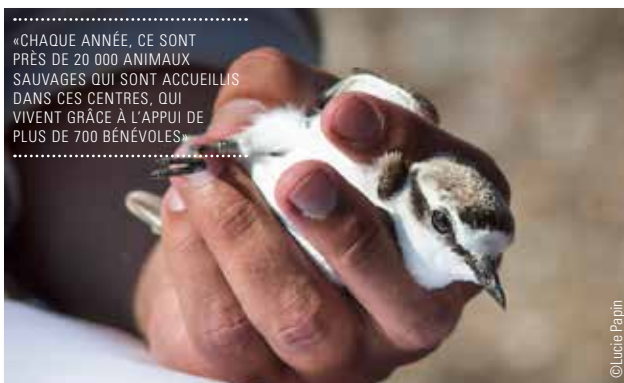
« CHAQUE ANNÉE, CE SONT PRÈS DE 20 000 ANIMAUX SAUVAGES QUI SONT ACCUEILLIS DANS CES CENTRES, QUI VIVENT GRÂCE À L'APPUI DE PLUS DE 700 BÉNÉVOLES »