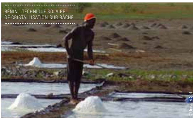
BÉNIN : TECHNIQUE SOLAIRE DE CRISTALLISATION SUR BÂCHE

En 2014, la situation financière de la Fondation n'a pas permis de relancer le dispositif de soutien. Cependant, depuis plusieurs années, la Fondation consacre une partie de ses moyens humains et financiers à l'accompagnement de projets phares illustrant particulièrement bien la transition écologique, dont certains portés par ses associations partenaires.